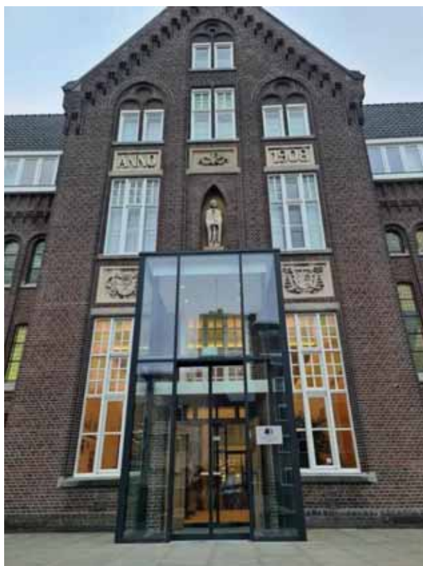
Herontwikkeling school naar hotel Sittard