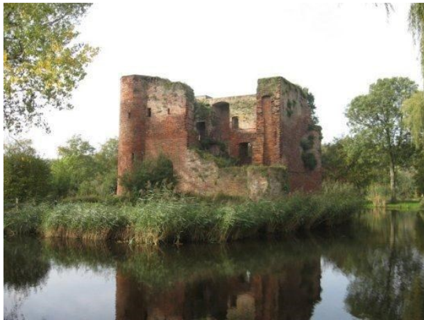
Afbeelding 4; Ruïne

Maar wat is er nu mooier dan afgebladderd schilderwerk, een scheve muur, een vervallen rieten dak? En schilderachtig metselwerk? Een gebouw is als ruïne ( afbeelding 4 ) eigenlijk op zijn mooist; dan beantwoordt het aan ons romantische ideaalbeeld als relict uit vroeger tijden.