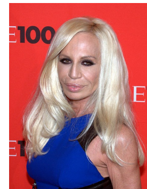
Afbeelding 3: Donatella Versace ná botox-behandelingen.

Vóór de restauratie was het Mauritshuis herkenbaar als oud gebouw en konden we ons voorstellen dat het om een voornaam gebouw uit de 17e eeuw ging. Na de restauratie is het een hard en afstandelijk gebouw geworden. Iedere scheur is gedicht en het schilderwerk is perfect uitgevoerd; het is weer als nieuw. Vergelijk het Mauritshuis vóór en na, met Donatella Versace na enkele botoxbehandelingen ( afbeelding 3 ). Aan beiden is toch iets teveel onderhoud gepleegd en de ziel is eruit verdwenen.