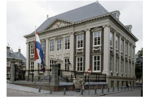
Afbeelding 2: Mauritshuis voor en na

Vóór de restauratie was het Mauritshuis herkenbaar als oud gebouw en konden we ons voorstellen dat het om een voornaam gebouw uit de 17e eeuw ging. Na de restauratie is het een hard en afstandelijk gebouw geworden. Iedere scheur is gedicht en het schilderwerk is perfect uitgevoerd; het is weer als nieuw. Vergelijk het Mauritshuis vóór en na, met Donatella Versace na enkele botoxbehandelingen ( afbeelding 3 ). Aan beiden is toch iets teveel onderhoud gepleegd en de ziel is eruit verdwenen.