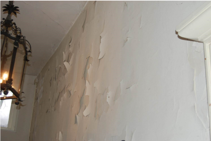
Afbeelding 1: Mooi afbladderend schilderwerk van de muur in mijn huis.

Al mijn hele leven lang vind ik oude dingen mooi. Maar waarom is dat toch? En waar zit hem dat dan in? Dit essay is een persoonlijke zoektocht naar het waarom. In mijn beleving gaat er bij oude gebouwen in Nederland tegenwoordig teveel schoonheid verloren doordat ze teveel opgeknapt worden. Mijn pleidooi is dan ook om de gebouwen ietsje minder op te knappen. En meer aandacht te hebben voor (behoud van) patina en imperfectie. Die zorgen voor de emotie die je ervaart als je naar oude gebouwen kijkt. Schoonheid als zintuiglijke beleving, daar gaat het om.