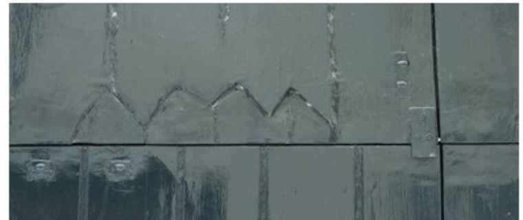
Afbeelding 6: Collage over patina en imperfectie